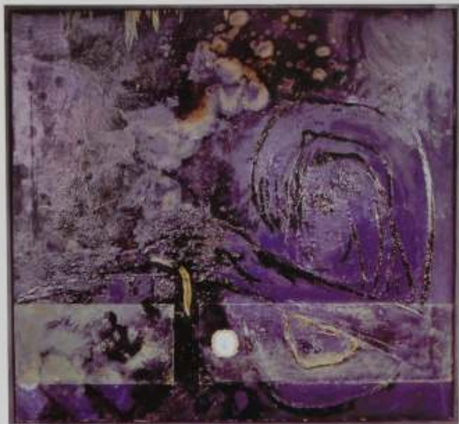
La joya del Miño 97 x 90,5 cm