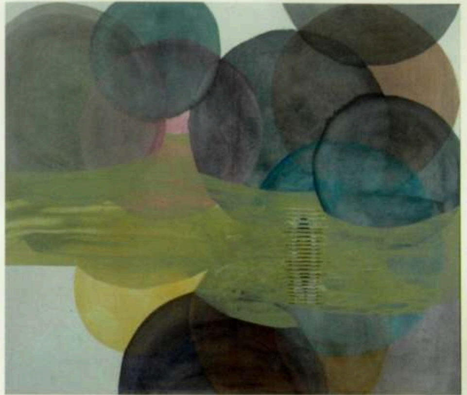
CARMEN HERMO Tu ojo a 1,20 del suelo. CDR Acrílico e impresión dixital sobre lenzo 160x120 2002