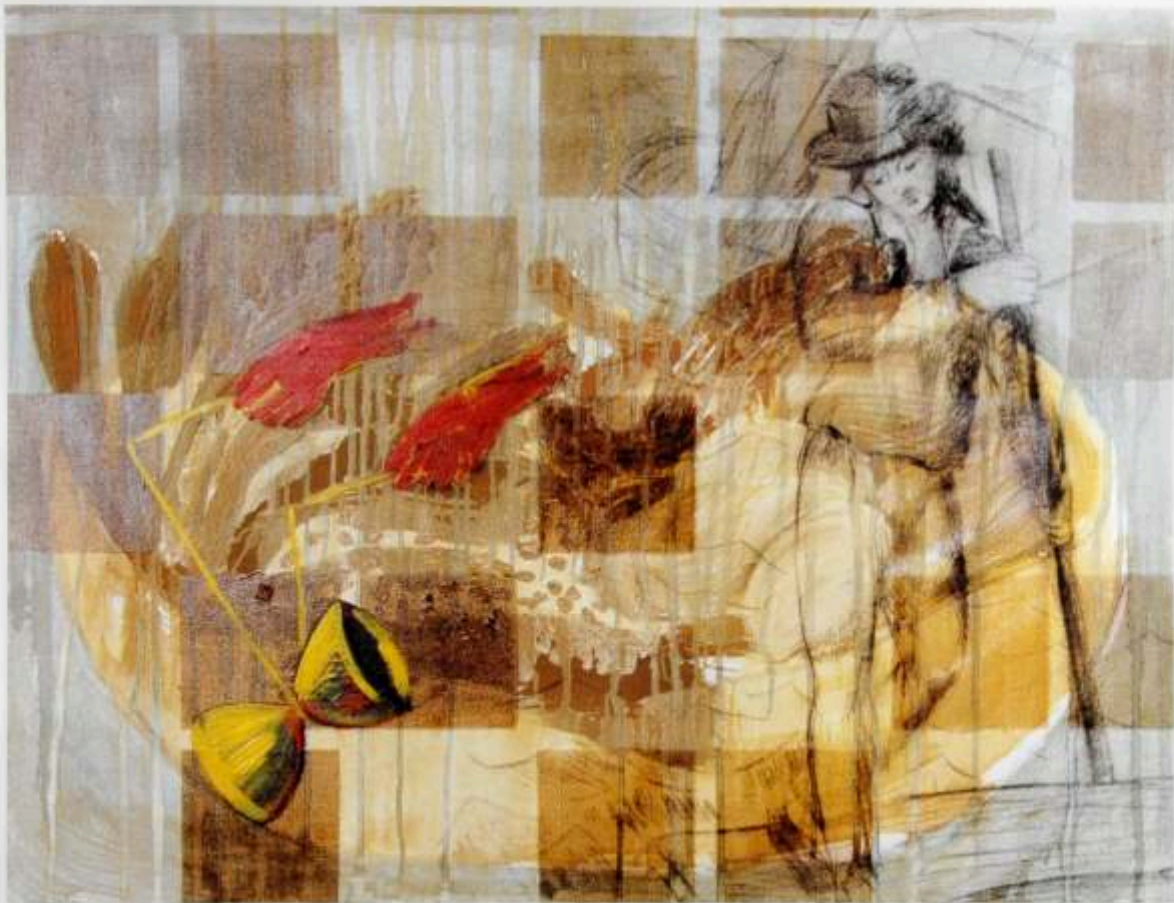
Nana con cocido, 1999