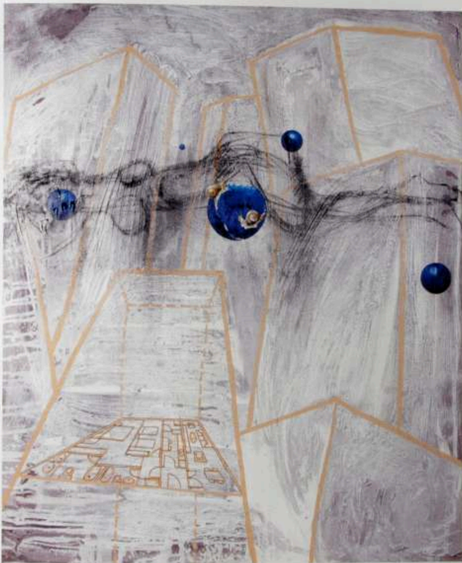
La ciudad me agobia, 2000