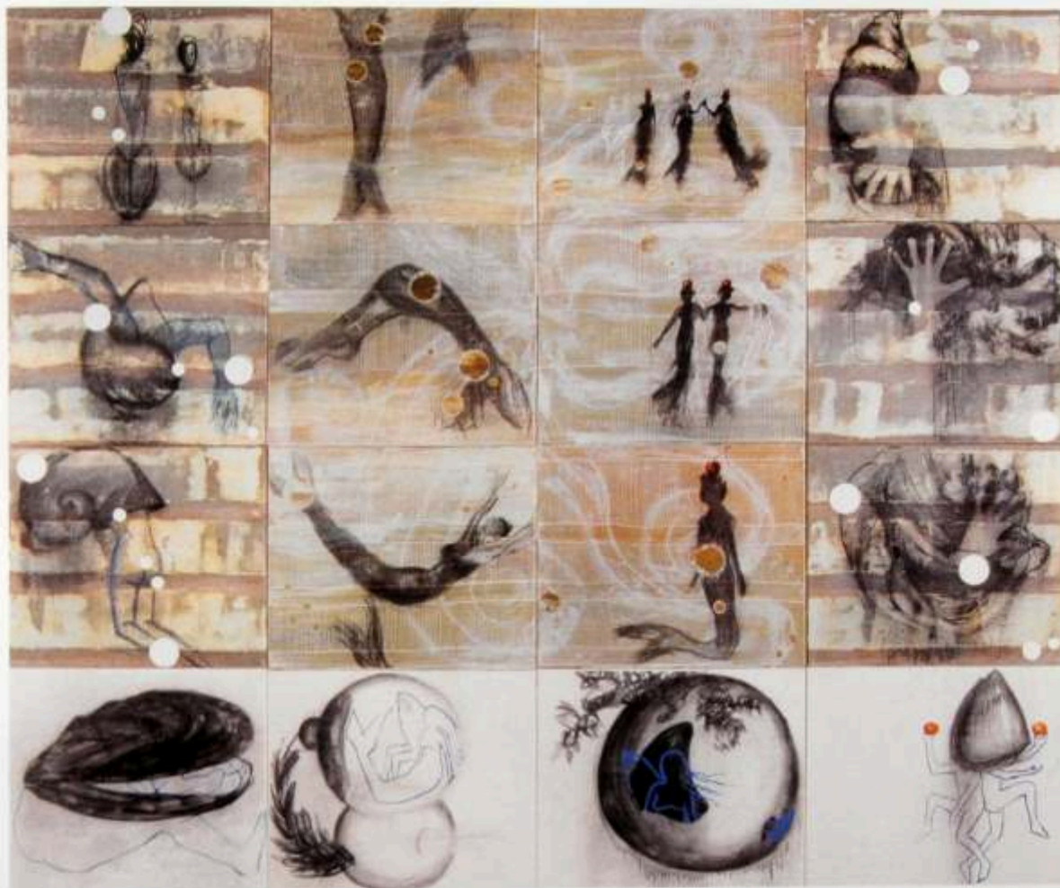
El océano de las delicias, 1998 (Serie de 12 independientes) Técnica Mixta s/lienzo (60 x 50 cm)