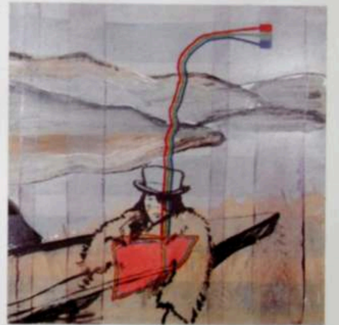
Estoy viendo la TV y haciendo un hígado. Mariví, 1998 (Serie de 4 independientes) Técnica Mixta a lienzo (100 x 100 cm)