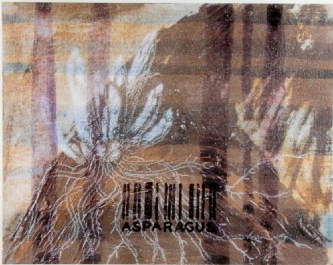
Soy metálico en el jardín botánico. Santiago, 1999