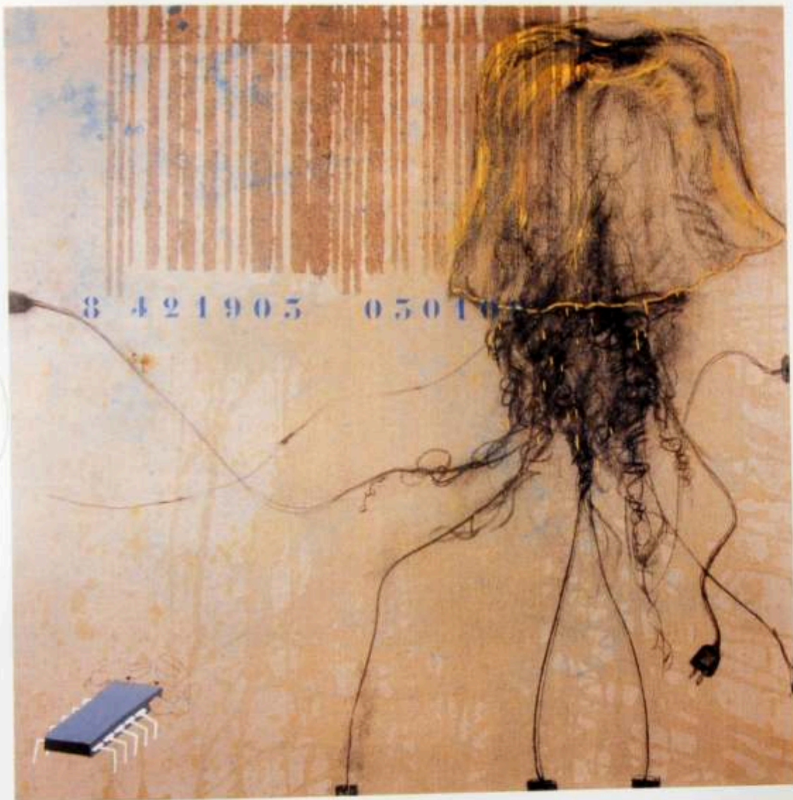
Jellyfish & chip, 1997