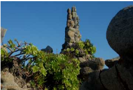
Otra vista del jardín-museo de Man. Detalle de una de las especies autóctonas que Man plantó para contribuir a la generación de un microclima.

Por otra parte la oferta expositiva debe ser atractiva para los diferentes niveles de lectura del público habitual de la obra de Man. Facilitar el conocimiento de lo que fue Man para acceder a su obra con conocimientos que posibiliten la comprensión del artista y su obra. Puede que esto se pudiese realizar en el Centro de Interpretación en las salas que el edificio tiene habilitadas para exposiciones temporales, con material elaborado por expertos en esta materia.