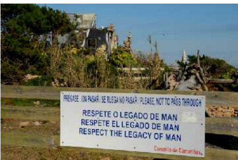
Cartel del cierre de madera colocado para evitar, hasta cierto punto, acceso al interior del jardín-museo.

La programación de actividades paralelas mantendría el interés por este centro ya no solo a nivel local, podría expandirse a nivel nacional e internacional. Los actuales cursos de Arte y Naturaleza a los que asisten artistas de toda la comunidad sería un buen ejemplo de esto. El primer encuentro en el que el artista invitado era Nils Udo resultó de sumo interés para todos sus asistentes y tuvo grandes repercusiones en cuanto a formación de grupos artísticos, exposiciones en diversas salas de gran importancia, artículos y textos en diversas publicaciones y edición de un video-documento.