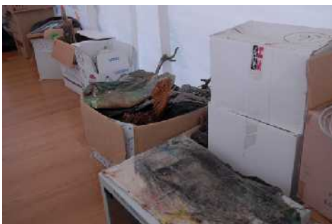
Cajas apiladas en la sede de la Fundación a la espera de su catalogación y conservación.

Podríamos diferenciar tres vertientes que abarcarían los tres planes fundamentales de investigación-ejecución de este proyecto: DOCUMENTACIÓN, RESTAURACIÓN, MUSEALIZACIÓN.