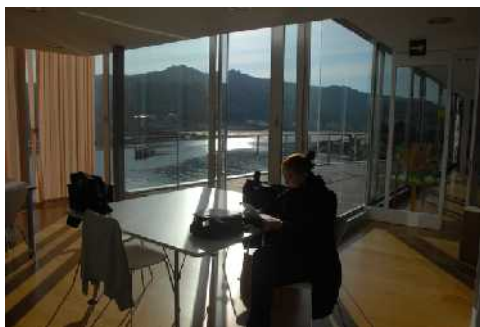
Sede de la Fundación Man de Camelle.

La figura jurídica más apropiada para regir la estructura y el funcionamiento del museo es la fundación, simple y útil para obtener apoyos y dinero. Esta fundación tendría su domicilio en la futura Casa da Cultura de Camelle, donde también se mostrará el archivo de su legado de dibujos y textos, además de publicaciones, hemeroteca o catálogos relacionados con el artista. Coincidiendo con el sexto aniversario de la muerte de Man queda oficialmente constituida la Fundación Man, que velará por la conservación y la divulgación del valioso legado del artista. 3