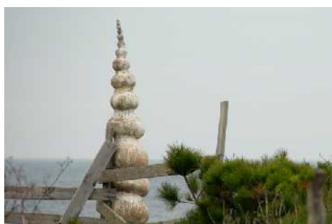
2. Obra y cierre provisional de madera.