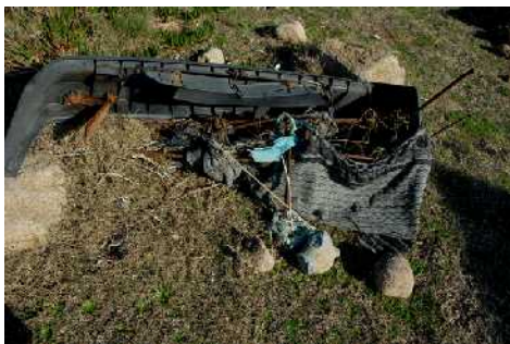
Defensa de coche y piedras con restos de mortero que formaban parte de una obra de Man y basura en las proximidades del jardín-museo.

fotográfico, etc, y por otro lado se hará una descripción de su estado de conservación, estudio agentes, alteraciones, análisis, registro fotográfico, etc. Se intentará localizar documentación gráfica, oral, o del tipo que sea de como era en principio esa obra, y poder visualizar su génesis en un material fotográfico, previamente datado, en determinado minuto de vídeo o en las referencias orales recogidas de la memoria de aquellos con los que la habían compartido con él.