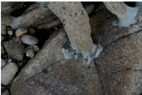
Detalle de pieza con mortero con carga de piedrecillas y restos de chapapote.