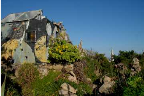
Vista del jardín-museo y caseta en la que aún se puede apreciar el autorretrato de Man en una de sus fachadas.

Partimos de un hecho interesante, la obra de Man es un lugar de referencia que recibe a lo largo de todo el año, incluso después de su muerte, gran afluencia de público. Estas visitas a este espacio abierto, descontrolado, por una parte son la causa de diversos actos vandálicos contra esta obra, pero por otra parte están garantizando el posible éxito del plan de musealización que nos ocupa.