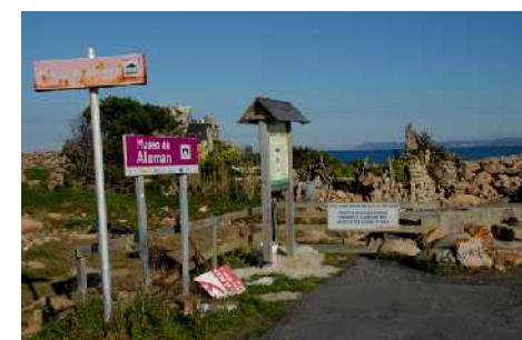
Estado general y carteles en diciembre de 2009.