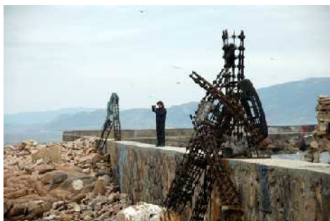
1. Muelle desde el que el visitante aprecia casi la totalidad del jardín-museo, en el 2007 aún se apreciaba la pieza de hierro en su lugar original.