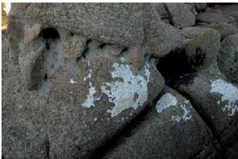
Piedra disgregada, mortero y restos de policromía.