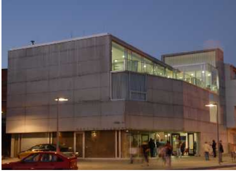
Casa do Alemán. Camelle. Ayuntamiento de Camariñas. A Coruña

octubre y estará previsiblemente terminado entre agosto y septiembre de 2005 2 . Aquel dinero se destinó para el edificio denominado A Casa do Alemán , actualmente empleado como una casa cultural para Camelle y sede de la Fundación Man. Edificación situada a unos 500 metros del muelle donde está la caseta de Man, dispone de salas de exposiciones, biblioteca, zona multimedia e instalaciones de servicio, aseos y cafetería. Se trata de un edificio abierto al paisaje fruto de un esmerado estudio realizado por los ganadores del concurso público promovido por el Ayuntamiento de Camariñas para el desarrollo de ese proyecto.