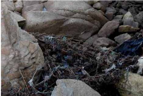
Aspecto actual de parte de los hierros que hasta el pasado año aún se encontraban anclados en el hormigón del muelle (ver foto 1 estado de la cuestión).