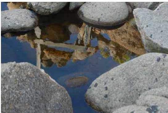
Piedras con chapapote y charca reflejando el cielo y una obra de Man.

Hay mucho trabajo por hacer, muchas formas de contribuir al freno de esta pérdida. Esta es una oferta a todos aquellos investigadores y futuros investigadores que deseen plantear cuestiones sobre un caso práctico real que necesita se le trate con la dignidad que se merece. Cuanto más nos aproximamos a la figura de Man y a su obra, a su estudio y documentación, más nos aproximaremos a entendernos a nosotros mismos y nuestra situación en el mundo.