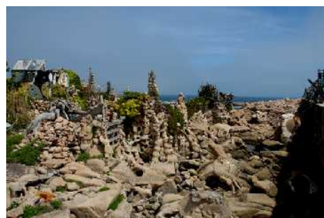
3. Vista general 2007.